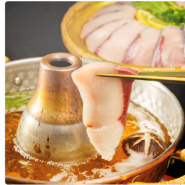
氷見産ぶりしゃぶ 200g 2チケット