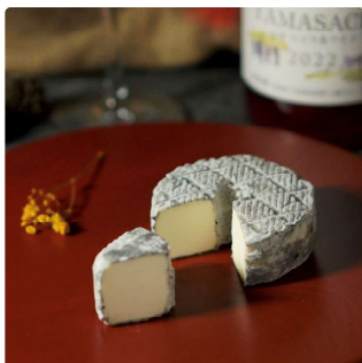
ナチュラルチーズ 9点セット 2チケット