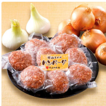
但馬牛・神戸牛入りハンバーグ 5個 1チケット