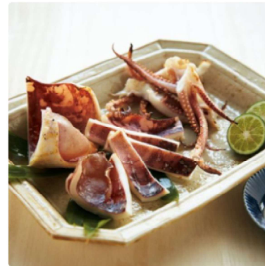
青森県産天日干しスルメイカセット 2チケット