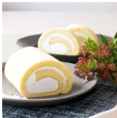
高道ロールとフィナンシェセット 1チケット