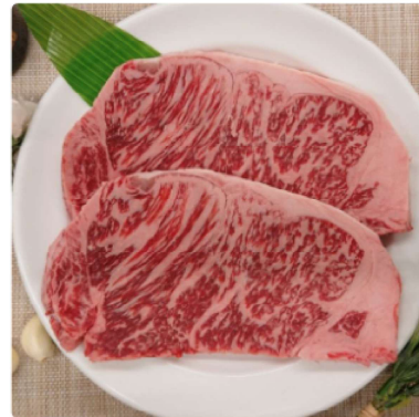
那須の後藤牛サーロインステーキ400g 2チケット