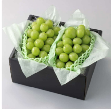
<季節の予約便>岡山県産シャインマスカット 1.4kg 2チケット