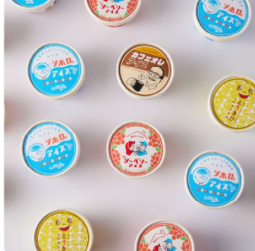
しほろアイスクリーム 18個セット 2チケット