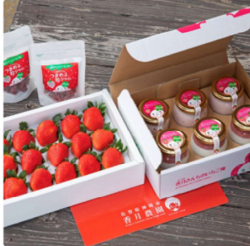
<季節の予約便>さがほのか大玉&いちごスイーツセット 2チケット