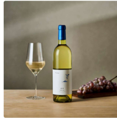
甲州3種 飲み比べセット 2チケット