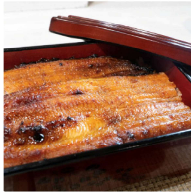
武州うなぎ蒲焼 2尾セット 2チケット