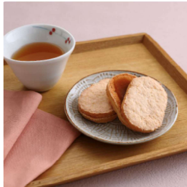
虎屋の知波乃実・どら焼きセット 1チケット