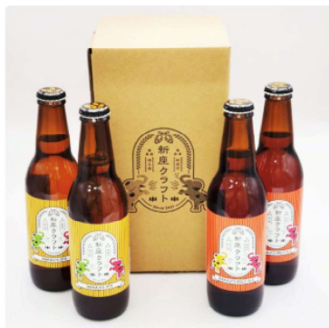
新座クラフト 2種 4本セット(化粧箱入) 1チケット