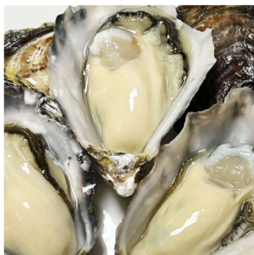
三重県英虞湾産シングルシードオイスター「アマテラス」 10個 1チケット