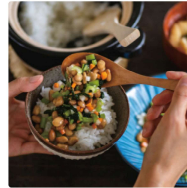
米どころ魚沼のごはんのおともセット 1チケット