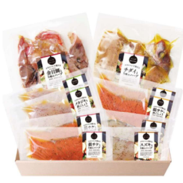
三陸の香味仕立て焼き魚 6種詰め合わせ セット 2チケット