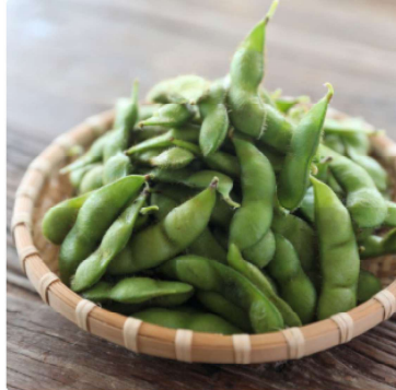
<季節の予約便>庄内町産「あんちゃ豆」 1.5kg 1チケット