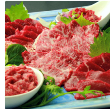
馬刺し 贅沢5種セット 2チケット